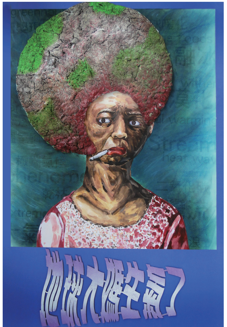
平面設計類佳作 / 地球大媽生氣了 / 919 林柏安