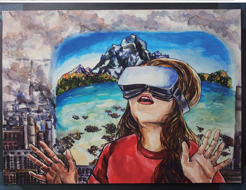
漫畫類佳作 虛擬實境 919 洪千茵