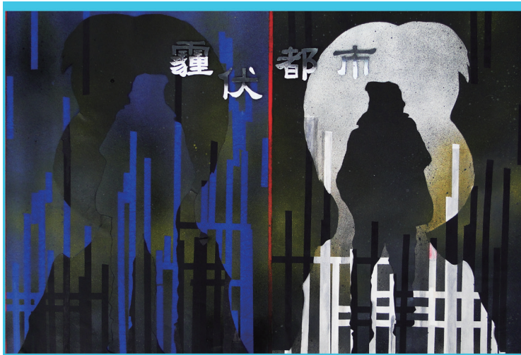
平面設計類佳作 / 霾伏 / 819 高聖華