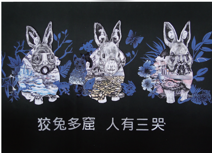
平面設計類佳作 / 狡兔三窟人有三哭 / 919 張巧薰