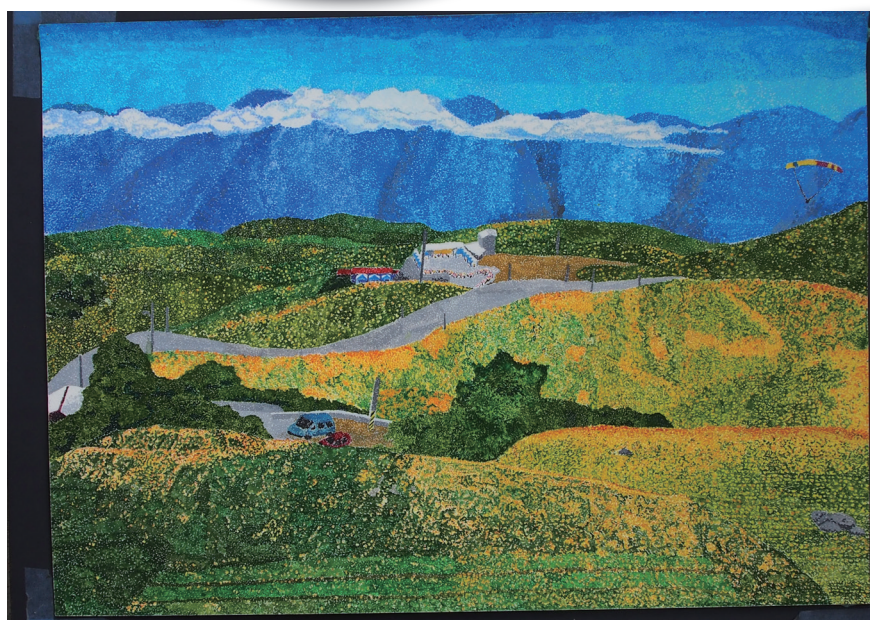
西畫類佳作 金針山 819 李采蓉