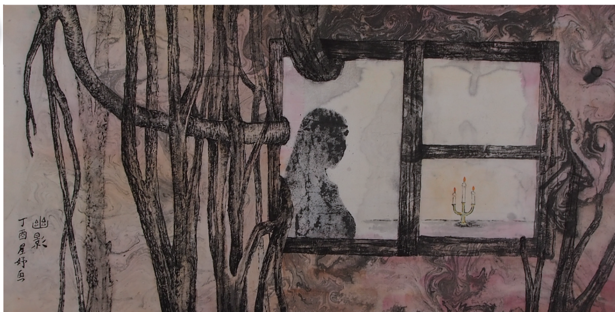
水墨類佳作 / 幽影 / 919 何星好