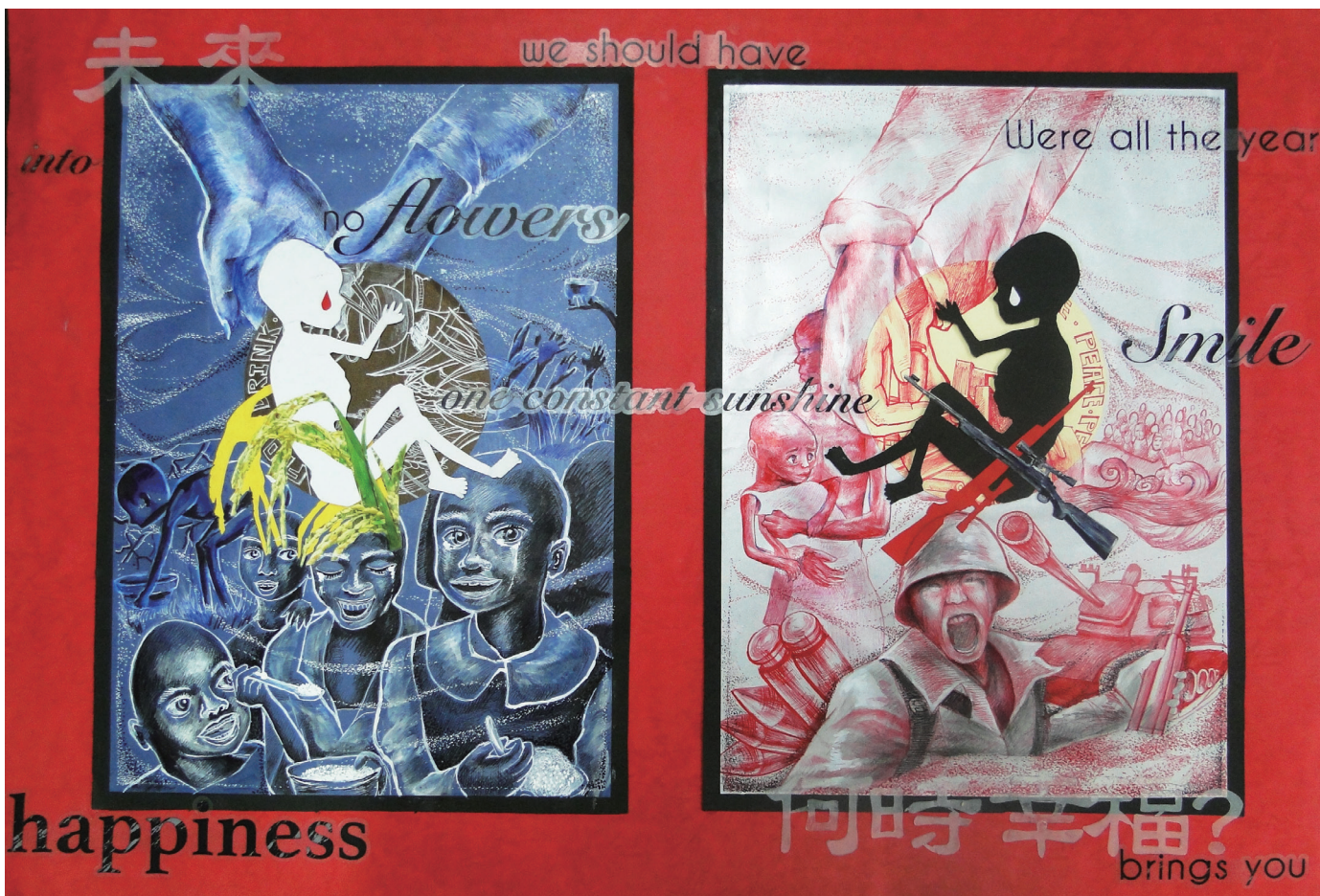
未來. 何時幸福 819 張巧薰 (平面設計佳作)