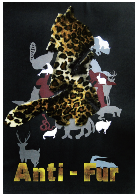
Anti-Fur 919 崔雅惠 (平面設計佳作)