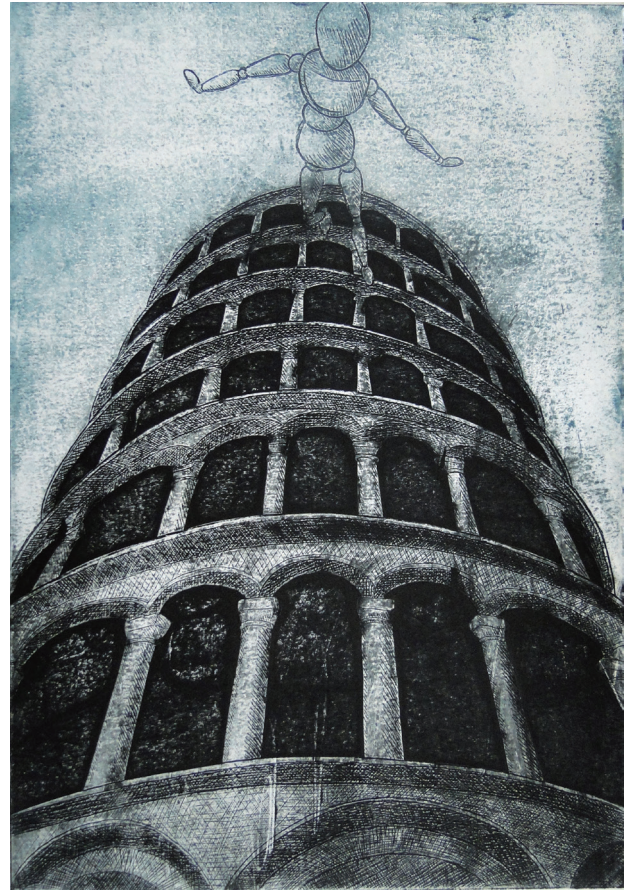
站在高峰 919 周采嬋 (版畫佳作)