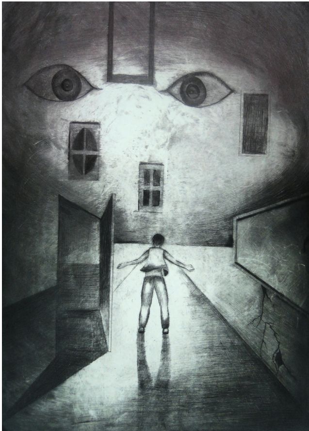
凝視 919 李丞憲 (版畫佳作)