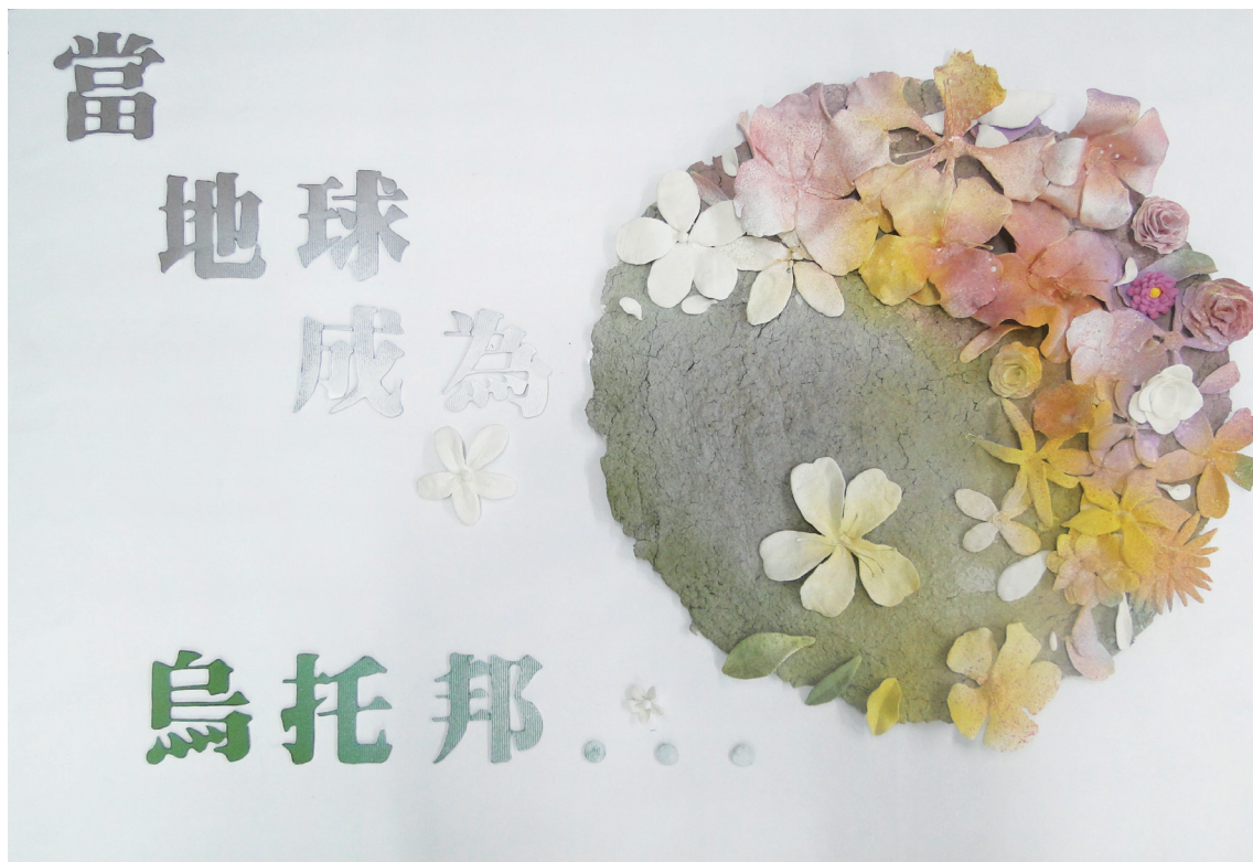
當地球成為烏托邦 919 張竣程 (平面設計佳作)