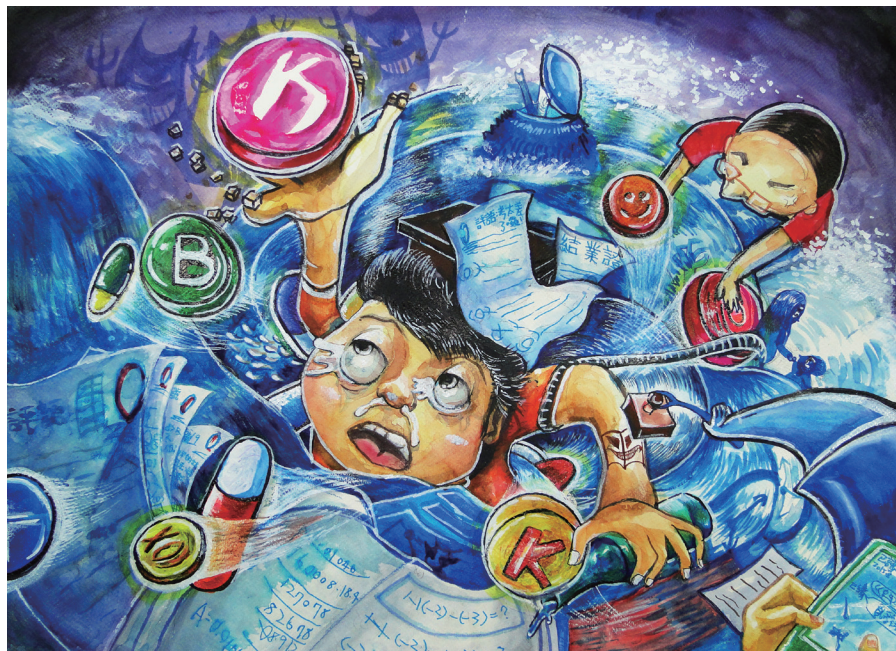
抓「寶」玩出「命」 819 張巧薰 (漫畫佳作)